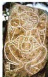
۱۱۴. اتابیرا - پورتوریکو - [۱۰]