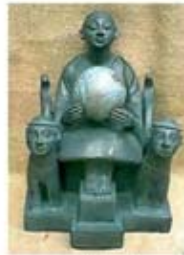
۳۷. گایا - سده ۷ ق.م. - [۱۲]