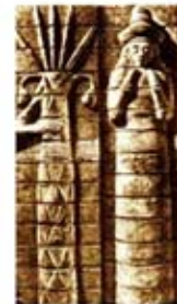
۷. تین لیل - [۱۰]