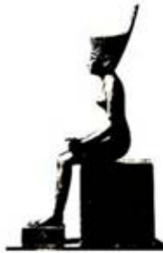
۸۱. نیت - [۲۷، ص ۱۱۸]