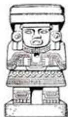
۱۰۴. ایزدبانوی آب - [۳۲، ص ۶۲]