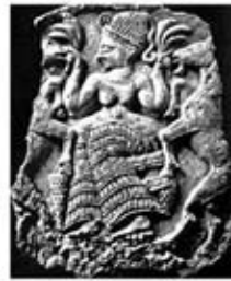
۱۳. نیک کال - اوگاریت - سده های ۱۴ تا ۱۳ ق.م. - [۹]