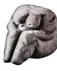
۱۹. الهه باروری - چتل هویوک - [۱۲ ص ۵۲]