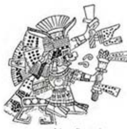
۱۰۹. چالچینولیکونه - [۳۲، ص ۱۷۰]