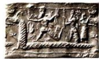
۱. کشته شدن تيامت به دست مردوخ - [۹ ص ۲۸۳]