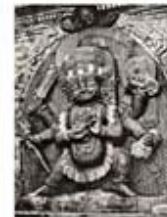
۹۳. کالی نیال - [۱۰]