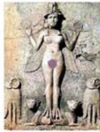
۳. ایشتر - کلکسیون نرمان کولویل - [۴۱]