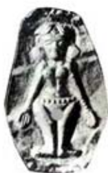
۸۸. الهه زمین - لوریا - [۲۸، ص ۳۵]