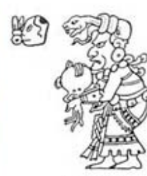
۱۱۳. ایشجل - [۳۲، ص ۲۵۷]