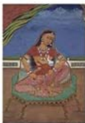
۹۰. پارواتی در حال شیر دادن به گانشا - [۱۰]