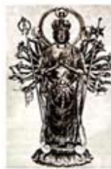
۱۰۲. کوان نون - [۳۱، ص ۹۱]