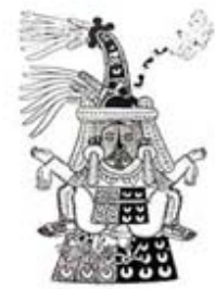
۱۰۶. تالاسوتوتل - [۳۲، ص ۱۷۷]