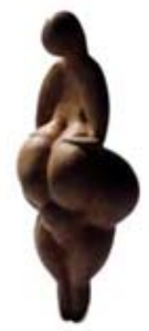
۲۸. ونوس لیوز - [۱۰]