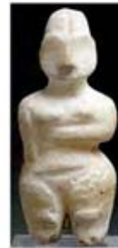
۸. الهه باروری - حسونا - حدود ۶۰۰ ق.م. - [۱۳]