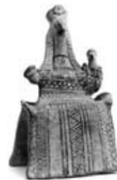
۳۶. مادر و کودک - تاناگرا، یونان - [۹] - ۵۵۰ ق.م.