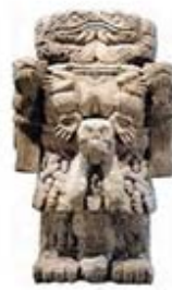
۱۰۸. کواتلیکونه - [۳۲، ص ۱۷۳]