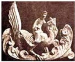
۹۸. فنگ هوآنگ - [۳۰، ص ۶۸]