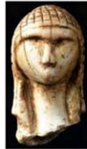
۲۹. ونوس بارسمیوی - [۱۰]