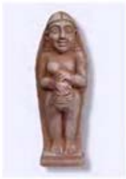
۱۶. سیدوری - سده ۸ ق.م. - [۴۰]