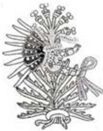
۱۱۱. مایاول - [۳۲، ص ۱۸۱]