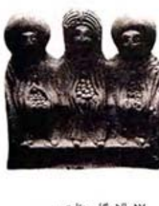
۵۷. الاحکان دناتمرس - راین - [۲۳، ص ۶۹]