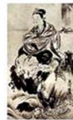
۱۰۰. بنتن - [۳۱، ص ۲۱۸]