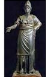
۵۱. مینروا - [۴۱]