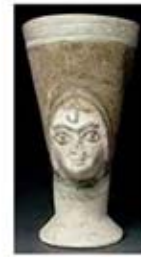
۱۲. جام - اوگاریت - سده های ۱۴ تا ۱۳ ق.م. - [۹]