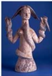
۱۵. هاسی - بابل - [۱۰]