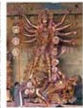
۹۲. دورگا - [۱۰]