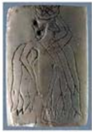
۵. ایشتر - ماری - ۲۵۰۰ تا ۲۴۰۰ ق.م. - [۹]