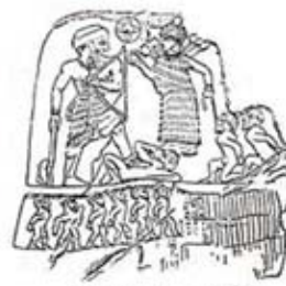
۲. انوبانی نی در برابر اینانا - سر پل ذهاب - [۶ ص ۵]