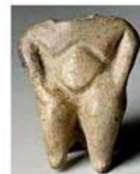
۱۸. الهه باروری - اناتولی - ۶۰۰ تا ۵۵۰ ق.م. - [۱۵ ص ۱۱۳۶]