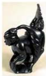
۱۱۷. سذنا - [۱۰]