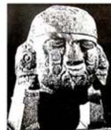
۱۱۲. کویلشاوکی - [۳۲، ص ۱۸۶]