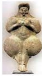
۳. اینانا - [۴۰]