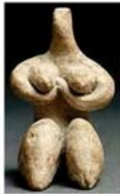
۹. الهه باروری - حلف - حدود ۵۱۰۰ تا ۶۰۰ ق.م. - [۹]