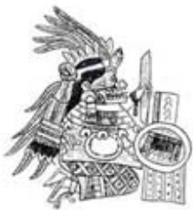
۱۰۵. سیواکواتل - [۳۲، ص ۱۸۹]