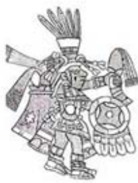
۱۱۰. سنه توتل - [۳۲، ص ۱۷۸]