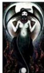
۱۱۶. ارناکوگاسک - [۱۰]