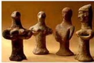
۱۰ و ۱۱. آشه راه - فلسطين - سده های ۱۰ تا ۷ ق.م. - [۴۲]