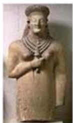
۲۲. بانوی تریکومو - قبرس - سده ۶ ق.م. - [۱۹ ص ۱۶۵]