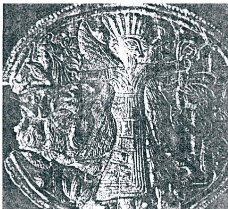
تصویر ۵ الهه‌ی بالدار که با دو دست، شیر یا پلنگ را آویزان نگاه داشته است. سر سنجاق مفرغی کنده‌کاری شده سرخدم لرستان، قرن ۸ ق.م. C.M ۱۴

هزاره‌ی اول ق.م، پلاک مفرغی و سینه‌بند طلایی گنجینه زیویه با تصاویر ابوالهله، بز بالدار معروف گنجینه جیهون در موزه‌ی لوور پاریس؛ [۱۳] لوح نقره‌ای گنجینه زیویه (ق ۷) موزه‌ی متروپولیتین با طرح دو حیوان دوقلو با سر شیر مشترک با بال تزیینی [۱۴، ص ۳۱۶ تصویر ۳۸۳]، تنگ سفالی بدل زیویه با نقش گاو دال تک‌شاخ با بال رنگارنگ [۱۵]، ترکش یا تیردان مفرغی قرن ۸ - ۷ ق.م. لرستان در موزه‌ی متروپولیتین [۱۶، ص ۷۰] با تصویر انسانهایی که برگ نخل در دست دارند با چیزی شبیه پر بزرگ شبیه بال است. در جام معروف زرین حسنلو، مربوط به هزاره‌ی اول ق.م. پیکره‌ی بالدار در بخش بالایی ظرف دیده می‌شود. بال پیکره، ساده و تک‌قسمتی است که مربوط به تمدن مانا می‌باشد. زهرا نیلدر مقاله خود به تصویر یک پلاک مفرغی با نقش الهه‌ی بالدار که با دو دست خود دو پلنگ را آویزان کرده و با پاهای شبیه پنجه عقاب بر پشت دو پلنگ قرار گرفته؛ اشاره کرده است [۱۷، ص ۲۶۰، تصویر ۳]. پیکره، عربان است و ۴ بال او از چهار ردیف پریز در بالا و شاه‌پره‌های کشیده و بلند تشکیل شده است. (تصویر ۵)