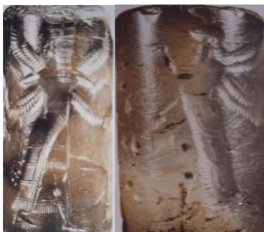
تصویر ۸ انسان بالداری (سمت راست)، (دو بال) مهر استوانه‌ای نیمه اول هزاره اول ق.م شماره ۵۴۵۱، گوارتز شیشه‌ای.

در مهرهای استوانه‌ای و مسطح آشور و هخامنشی، پیکره‌ی بالداری کاهنان در حال نیایش با دو یا چهار بال دیده می‌شود. قرص بالداری، تجسم خدای حاصل‌خیزی و دلو در دو دست کاهن، نماد باران‌زایی است. فرم کلی ظاهری تمام این مهرها به خصوص در مجموعه سیوا نیری اکثراً مشابه است. (تصویرهای ۸ - ۹ - ۱۰) بال‌های دو قسمتی هستند. این مهرها مربوط به هزاره‌ی اول ق.م. هستند [۲۰، صص ۳۸، ۳۵، ۲۴].