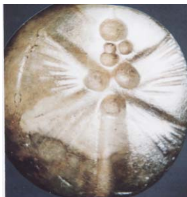
تصویر ۹ انسان بالدار (سمت چپ) (چهار بال) مهر استوانه‌ای نیمه اول هزاره اول ق.م شماره ۵۴۳۳، سنگ خاکستری.