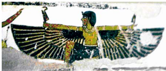
تصویر ۱ تصویر هوروس خدای آسمان، نقاشی روی دیوار، مصر

ایزیس مادر هوروس خدای آسمان، بر دیوار معابد به صورت انسانی با بالهای گشاده ترسیم می‌شد (تصویر ۱). اما این انسان بالدار، بر اساس آیین ارفه‌ای مطابق با مفهوم فرشته نیست.