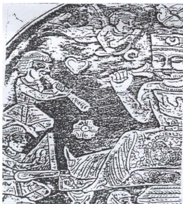
تصویر ۱۴ شاه در میان ملازمان و تصویر فرشته محافظ بالای سر، بخشی از سینی چکش کاری شده نقره‌ای ساسانی

فریر واشنگتن که در آن در بخش بالا سمت چپ کودک فرشته عریان با چوبی بلند در دست دیده می‌شوند و یکی احتمالاً جام شراب در دست دارد که نقش آنها با طرح پیچان تاک بالای سر پیکر اصلی در ارتباط است. کودک فرشته نیز در پایین تصویر تخت پیکره اصلی در طرفین یک چرخ دیده می‌شود. سر فرشتگان نسبت به بدن بی تناسب است، بال‌ها کوتاه است و از دو بخش اصلی تشکیل شده است. زن نشسته بر تخت و سایر پیکره‌ها نیمه برهنه‌اند (تصویر ۱۴). نمونه موجود دیگر در همین گالری تصویر شاه با نوازندگان و خدمتکاران است که فرشته‌ای در بالای سر او روبانی را در دست دارد. پیکره‌ها (همگی مرد) و فرشته‌ها در این تصویر؛ همگی ملبسند (تصویر ۱۵). چکش کاری روی ظروف و نقش برجسته‌های این دوره، ذره‌گرایی هخامنشی را احیا نموده است.