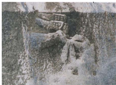
تصویر ۱۲ فرشته بالایی سر گودرز، بیستون کرمانشاه، دوره یونانی مآبی زمان مهرداد دوم اشکانی (پارتی)، (۲۲۶ - ۲۵۰ ق.م.)