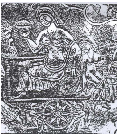
تصویر ۱۵ ملکه نشسته بر تخت با ظرف انگور در میان نوازندگان، با دو فرشته در سمت چپ بالا و دو فرشته پایین تخت؛ بخشی از سینی چکش کاری شده نقره‌ای ساسانی.

ق.م. این تأثیرات در فرم لباس و بال فرشتگان مشاهده گردد. نقش فرشته بالایی سر گودرز در بیستون کرمانشاه (تصویر ۱۲) از نمونه آثار دوره یونانی مآبی است. این نقش طبق نظر مسعود آذرنوش باستان‌شناس احتمالاً باید نقش نیکه (الهه‌ی عشق یونانی) باشد که نقشی معادل سروش دارد. احتمال دارد این فرشته سروش باشد. تصویر نیکه به صورت بالداری با شاخه خرما در دست؛ و تصویر اروس خدای عشق یونانی اغلب به صورت کودک‌دکان عریان در سکه‌های اشکانی و ساسانی [۲۱، تصاویر] دیده می‌شود. از مشهورترین نمود تأثیرات یونان، شکل دو فرشته نگهبان در طاق‌بستان کرمانشاه است (تصویر ۱۳).