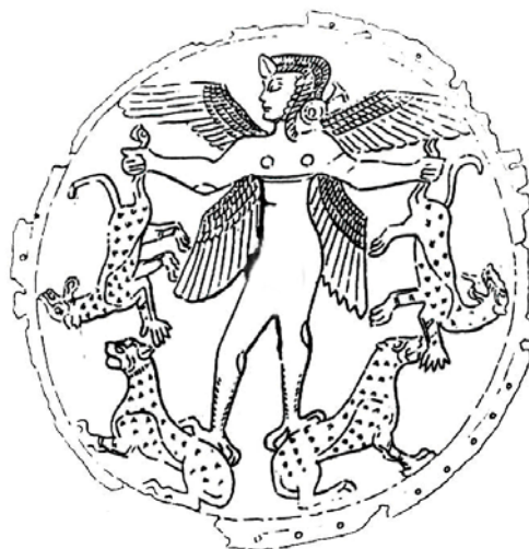
تصویر ۶ پیکره‌ی بالداری که دو پلنگ را آویزان نگه داشته است. پلاک مفرغی، احتمالاً سکاها

به تزیینات زین و برگ اسب قرن ۷ ق.م. از کارمسکایا استانیترزا در موزه ارمیتاژ نیز پیکره‌ی زنی بالداری که دو شیر به صورت آویزان در دست گرفته، دیده می‌شود. دو بال سه قسمتی پیکره در انتها کمی حالت مدور گرفته‌اند [۶، صص ۳۷۸، تصویر ۵۳۳].