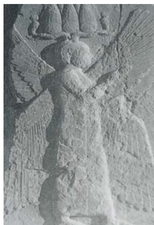
تصویر ۱۰ انسان بالدار، مهر مسطح، نیمه اول هزاره اول ق.م. شماره ۵۲۳۳، احتمالاً آشور جدید سنگ زیتونی رنگ.

تصویر ۱۱ انسان بالدار با لباس عیلامی و تاج تقریباً مصری، جزر سنگی، درگاه شمالی کاخ شرقی، تالار کوچک پاسارگاد ارتفاع ۳ متر، دوره هخامنشیان، قرن ۶ ق.م.