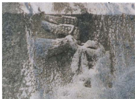
تصویر ۱۲ فرشته بالایی سر گودرز، بیستون کرمانشاه، دوره یونانی مآبی زمان مهرداد دوم اشکانی (پارتی)، (۲۲۶ - ۲۵۰ ق.م.)