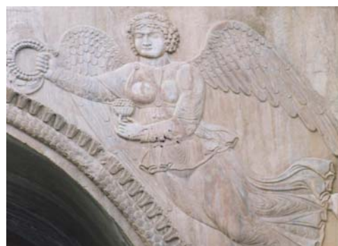
تصویر ۱۳ دو فرشته (احتمالاً نگهبان) دیهیم در دست، سردر ورودی طاق‌بستان کرمانشاه، زمان اردشیر دوم ساسانی

فرم بال در این تصویر طبیعی است و از بال شبیه پرنندگان اقتباس شده است. فرم لباس و سایر جزئیات رومی و یونانی است.