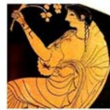
۴۰. نقش هستیا بر روی سفال - [۴۵]