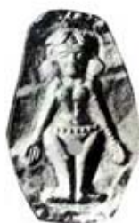
۸۸. الهه زمین - لوریا - [۲۸، ص ۳۵]