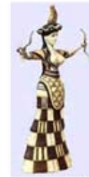
۳۵. الهه ماری - مینوس - سده های ۱۵ تا ۱۶ ق.م. - [۱۰]