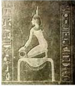
۷۲. ایزیس - [۴۷]