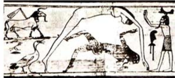
۷۴. نوت (آسمان) بر بالای جب (زمین) خیمه زده است - [۹، ص ۲۲۸]