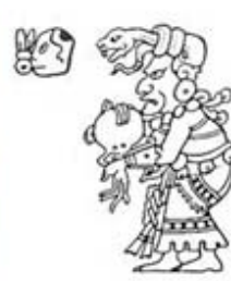
۱۱۳. ایشجل - [۳۲، ص ۲۵۷]