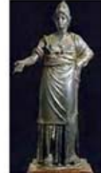
۵۱. مینروا - [۴۱]