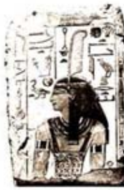
۸۳. سلکت - [۲۷، ص ۱۸۸]