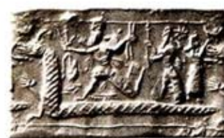
۱. کشته شدن تيامت به دست مردوخ - [۹ ص ۲۸۳]