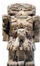
۱۰۸. کواتلیکونه - [۳۲، ص ۱۷۲]