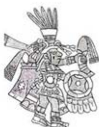
۱۱۰. سنه توتل - [۳۲، ص ۱۷۸]