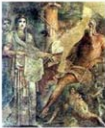
۳۹. نقاشی دیواری هرا - [۴۵]