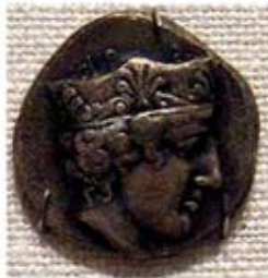
۳۸. سکه با نقش هرا - [۴۵]