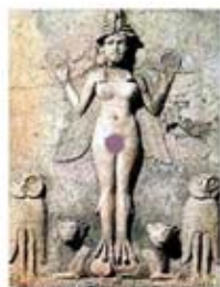
۳. ایشتار - کلکسیون نرمان کولویل - [۴۱]