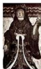
۱۰۱. کیشی جونن - [۳۱، ص ۳۱]