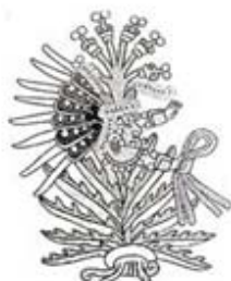
۱۱۱. مایاول - [۳۲، ص ۱۸۱]