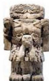
۱۰۸. کواتلیکونه - [۳۲، ص ۱۷۲]