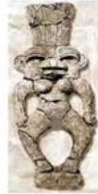
۷۰. به ست - سودان [۴۷]