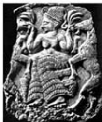
۱۳. نیک کال - اوگاریت - سده های ۱۴ تا ۱۳ ق.م. - [۹]