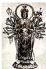
۱۰۲. کوان نون - [۳۱، ص ۹۱]