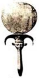
۷۸. هاتور بر آینه - [۲۷، ص ۱۲۶]