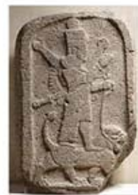
۶. ایشتار - تل برسیب - سده ۸ ق.م. - [۹]