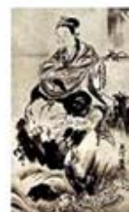
۱۰۰. بنتن - [۳۱، ص ۲۱۸]