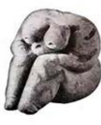
۱۹. الهه باروری - چتل هویوک - [۱۲ ص ۵۲]