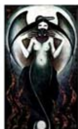
۱۱۶. ارناکوگاسک - [۱۰]