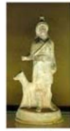
۴۵. بندیس - [۱۰]