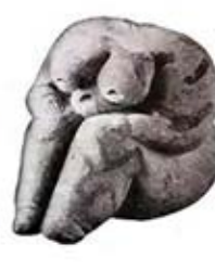
۱۹. الهه باروری - چتل هویوک - [۱۲ ص ۵۲]