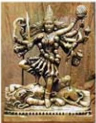
۹۱. کالی - [۱۰]