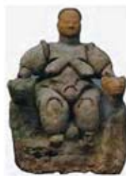
۲۰. الهه باروری - چتل هویوک - [۴۰]