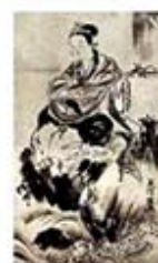
۱۰۰. بنتن - [۳۱، ص ۲۱۸]