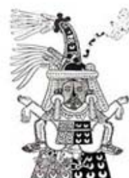
۱۰۶. تالاسوتوتل - [۳۲، ص ۱۷۷]