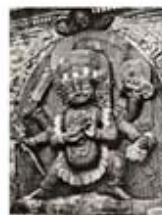
۹۳. کالی نیال - [۱۰]