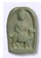
۱۷. اللات - خناسر، سوریه - سده ۱ ق.م. - [۴۰]