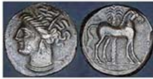
۲۵. سکه با نقش الهه باروری - کارتاز - [۲۱]