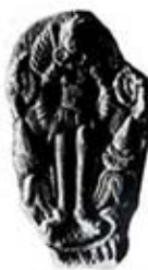
۸۹. ایزدبانوی بالدار - بساره - [۲۸، ص ۴۰]