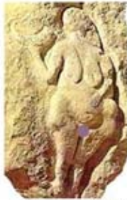
۲۶. الهه باروری - لاسال، درنی - [۴۳]