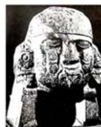
۱۱۲. کویلشاوکی - [۳۲، ص ۱۸۶]