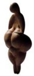
۲۸. ونوس لیبوز - [۱۰]