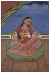
۹۰. پارواتی در حال شیر دادن به گانشا - [۱۰]