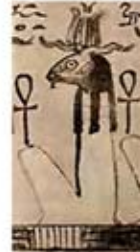
۷۵. تفنوت - [۲۷، ص ۶۷]