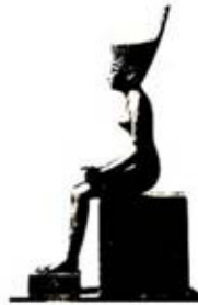
۸۱. نیت - [۲۷، ص ۱۱۸]