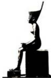
۸۱. نیت - [۲۷، ص ۱۱۸]