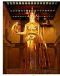
۴۶. آتنا - [۴۱]