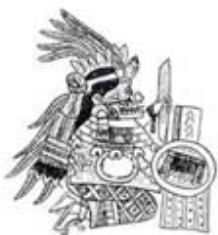
۱۰۵. سیواکواتل - [۳۲، ص ۱۸۹]