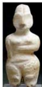
۸. الهه باروری - حسونا - حدود ۶۰۰ ق.م. - [۱۳]