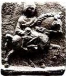
۵۵. اپونا - راین - [۲۳، ص ۲۵]