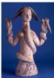
۱۵. هاسی - بابل - [۱۰]