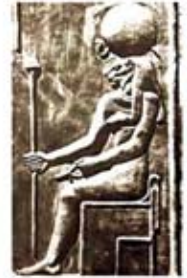
۷۹. مسخت - [۲۷، ص ۱۲۲]