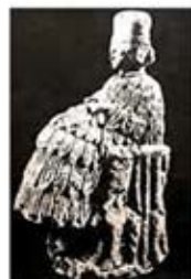
۱۴. الهه باروری - ماری - [۱۱ ص ۴۱]