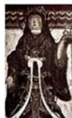
۱۰۱. کیشی جونن - [۳۱، ص ۳۱]