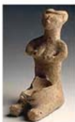
۲۱. الهه باروری - قبرس - هزاره ۴ تا ۳ ق.م. - [۱۸]