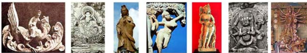
۹۸. فنگ هوآنگ - [۳۰، ص ۶۸]