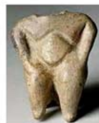
۱۸. الهه باروری - اناتولی - ۶۰۰ تا ۵۵۰ ق.م. - [۱۵ ص ۱۱۳۶]