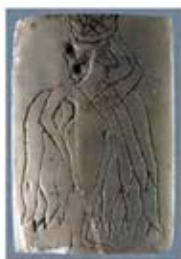
۵. ایشتار - ماری - ۲۵۰۰ تا ۲۴۰۰ ق.م. - [۹]