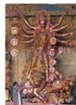
۹۲. دورگا - [۱۰]