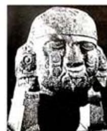
۱۱۲. کویلشاوکی - [۳۲، ص ۱۸۶]