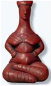
۳۳ تا ۳۴. الاهگان ماری - کرت - [۱۰]