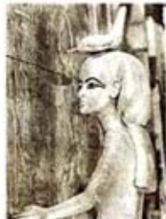
۸۵. ماعت - [۲۷، ص ۱۷۷]