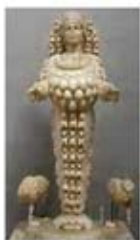
۴۴. آرتیس - [۴۱]