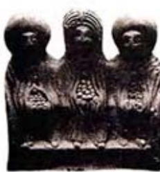
۵۷. الاحکان دناتمرس - راین - [۲۳، ص ۶۹]