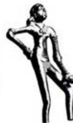
۸۷. دختر رقصان - موهنجودارو - [۲۸، ص ۱۷]