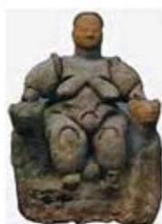
۲۰. الهه باروری - چتل هویوک - [۴۰]