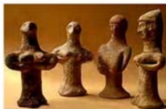
۱۰ و ۱۱. آشه راه - فلسطين - سده های ۱۰ تا ۷ ق.م. - [۴۲]