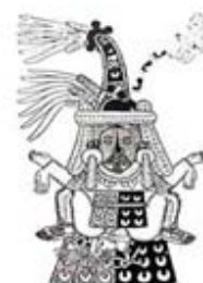
۱۰۶. تلاسوتوتل - [۳۲، ص ۱۷۷]