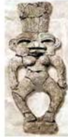
۷۰. به ست - سودان [۴۷]