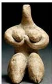
۹. الهه باروری - حلف - حدود ۵۱۰۰ تا ۶۰۰ ق.م. - [۹]