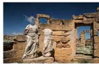
۴۱. دیتمتر و پرسیفون - سیرنه - [۴۳]