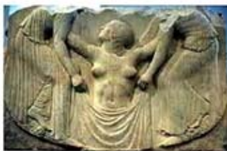
۴۳. حمام آفرودیت - [۴۳]