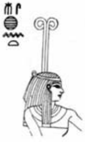
۸۴. مسخت - [۱۰]