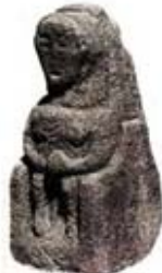
۵۴. الهه باروری - کارونت، ولز جنوبی - [۲۳، ص ۶۳]