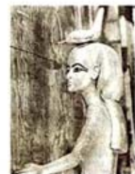
۸۵. ماعت - [۲۷، ص ۱۷۷]