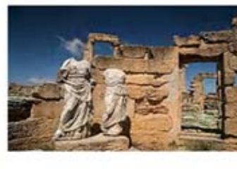
۴۱. دیتمتر و پرسیفون - سیرنه - [۴۳]