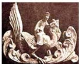
۹۸. فنگ هوآنگ - [۳۰، ص ۶۸]