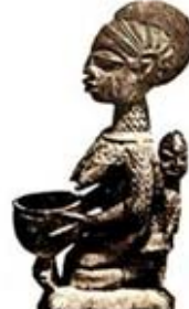
۶۴. تندیس سفالین مادر یا کودک - [۲۴، ص ۱۴۸]