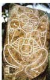
۱۱۴. اناپیرا - پورتوریکو - [۱۰]