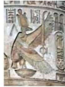
۸۰. نکیت - [۱۰]