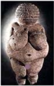
۲۷. ونوس ویلندورف - [۱۴، ص ۳۸]