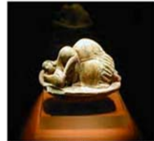
۲۳ و ۲۴. ونوس مالتا - موزه ملی مالت - [۱۲]