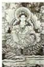
۹۷. تولد کوان بین - [۳۰، ص ۱۵۳]