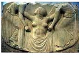
۴۳. حمام آفرودیت - [۴۳]