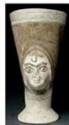
۱۲. جام - اوگاریت - سده های ۱۴ تا ۱۳ ق.م. - [۹]