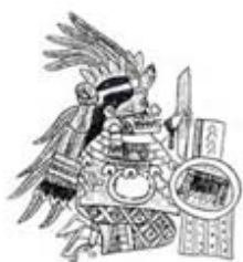
۱۰۵. سیواکواتل - [۳۲، ص ۱۸۹]