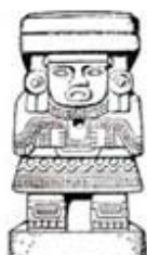
۱۰۴. ایزدبانوی آب - [۳۲، ص ۶۲]