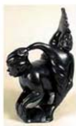
۱۱۷. سذنا - [۱۰]