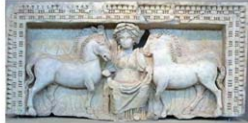
۵۶. اپونا [۴۵]