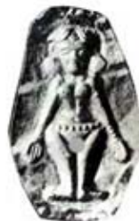
۸۸. الهه زمین - لوریا - [۲۸، ص ۳۵]