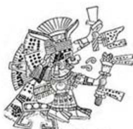
۱۰۹. چالچینتلیکونه - [۳۲، ص ۱۷۰]