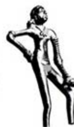
۸۷. دختر رقصان - موهنجودارو - [۲۸، ص ۱۷]