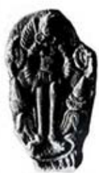
۸۹. ایزدبانوی بالدار - بساره - [۲۸، ص ۴۰]