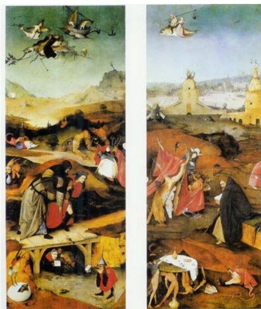
تصویر ۳ لت‌های جانبی وسوسه‌ی آنتونی قدیس. لت سمت راست: آنتونی قدیس در حال مراقبه. لت سمت چپ: پرواز و شکست آنتونی قدیس

به‌ویژه در مورد دوران گوتیک و باززایش (رنسانس) در اروپا و علی‌الخصوص مناطق فلاندر و آلمان که به شدت تحت تأثیر اعتقادات مسیحی قرار داشتند و نیز در ایران قرون هشت، نه و ده هجری که مذهب همراه با عرفان و تصوف بخش مهمی از حیات فرهنگی و ادبیات ایران تشکیل می‌دادند؛ صادق می‌باشد. این چنین است که طی این دوران بزرگترین آثار هنری در فلاندر و آلمان در قالب آذین محراب‌های کلیساها و در ایران در قالب تذهیب‌گری و تصویرسازی کتب ادبی با صیغه عرفانی و مذهبی خلق می‌شوند. نقاشان مکتب فلاندر و آلمان همچون نگارگران ایرانی نسبت به بازنمایی جزئیات و تزئین اثر از طریق اهمیت دادن به جزء جزء اثر و پرداخت وسواس‌گونه آنها علاقه فراوانی دارند؛ با این حال نگارگر ایرانی نگاهی درون‌گرا دارد و توجه او معطوف به جهان درونی اثر است حال آن‌که نقاشان مکتب فلاندر و آلمان توجه به عالم بیرون و نگاهی برون‌گرا دارند. گو اینکه رویکرد هر دو گروه به اثر، در خدمت ایجاد وحدتی اندام‌وار در کل اثر و در نهایت هماهنگی مضمون با شکل اثر یا هم‌خوانی صورت و معنا می‌باشد.