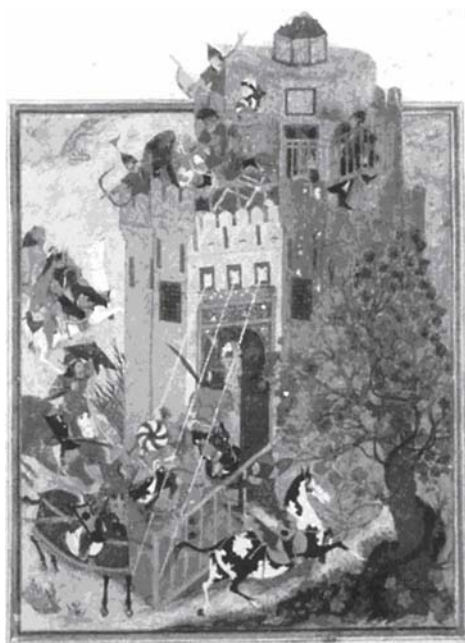
تصویر ۵ ظفرنامه تیموری، نیمه دوم قرن نهم هجری، مکتب هرات، منسوب به بهزاد

به‌ویژه در مورد دوران گوتیک و باززایش (رنسانس) در اروپا و علی‌الخصوص مناطق فلاندر و آلمان که به شدت تحت تأثیر اعتقادات مسیحی قرار داشتند و نیز در ایران قرون هشت، نه و ده هجری که مذهب همراه با عرفان و تصوف بخش مهمی از حیات فرهنگی و ادبیات ایران تشکیل می‌دادند؛ صادق می‌باشد. این چنین است که طی این دوران بزرگترین آثار هنری در فلاندر و آلمان در قالب آذین محراب‌های کلیساها و در ایران در قالب تذهیب‌گری و تصویرسازی کتب ادبی با صیغه عرفانی و مذهبی خلق می‌شوند. نقاشان مکتب فلاندر و آلمان همچون نگارگران ایرانی نسبت به بازنمایی جزئیات و تزئین اثر از طریق اهمیت دادن به جزء جزء اثر و پرداخت وسواس‌گونه آنها علاقه فراوانی دارند؛ با این حال نگارگر ایرانی نگاهی درون‌گرا دارد و توجه او معطوف به جهان درونی اثر است حال آن‌که نقاشان مکتب فلاندر و آلمان توجه به عالم بیرون و نگاهی برون‌گرا دارند. گو اینکه رویکرد هر دو گروه به اثر، در خدمت ایجاد وحدتی اندام‌وار در کل اثر و در نهایت هماهنگی مضمون با شکل اثر یا هم‌خوانی صورت و معنا می‌باشد.