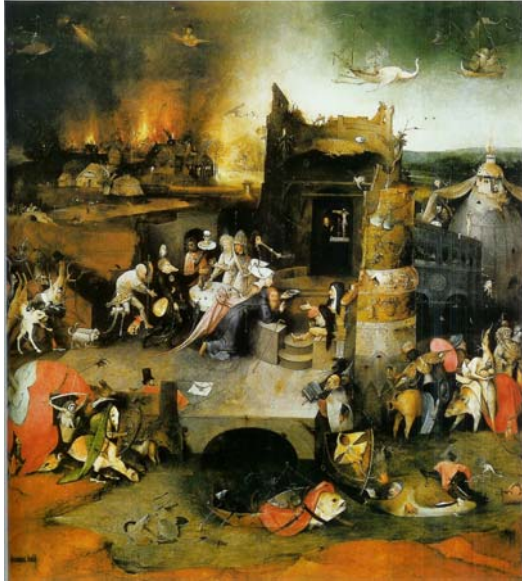
تصویر ۱ نقاشی سه‌لته‌ی وسوسه‌ی آنتونی قدیس اثر هیرونیموس بوش در اواخر قرن ۱۵ میلادی. لت مرکزی: پیروزی آنتونی قدیس

شاهد اولین جرقه‌های گرایش به زیبایی طبیعی و در نهایت طبیعت‌گرایی هستیم. حساسیت در برابر زیبایی بشری و طبیعی، که ارزشی مثبت تلقی شده است.