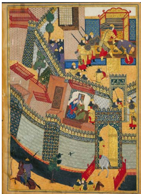
تصویر ۴ کشتن اسفندیار ارجاسب را در روین دژ، شاهنامه بایسنقری، مکتب هرات نیمه اول قرن نهم هجری

ناپیدا و ناگفته‌های تاریخ، نور حقیقت تاباند؛ اگرچه هنر خود توصیف‌گر خویش است و بهترین شاهد تاریخ. هنرمند را گریزی از ثبت وقایع و جهان پیرامون خود نیست پس اثر او پاسخ‌گوی بسیاری از مجهولات تاریخ است.