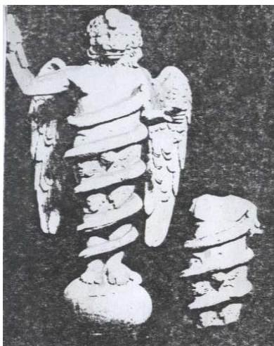
تصویر ۴ تصویر معروف کیش مهر که بعضی آن را زروان خدای بزرگ و بعضی آن را اهریمن دانسته اند، مجسمه بازسازی شده

یکی از تصاویر معروف کیش مهر مجسمه بازسازی شده‌ی خدایی به صورت مرد بالدار با سر شیر است که ظاهراً ماری دور او پیچیده شده که ملازم اوست. [۱۱، صص ۱۲۸ - ۱۳۰] (تصویر ۴) این مجسمه‌ها در بسیاری معابد مهری دیده می‌شود البته بعضی آن را نماد اهریمن یا زروان می‌دانند. بال‌های او طبیعت‌گرا و شبیه بال پرندگان است.