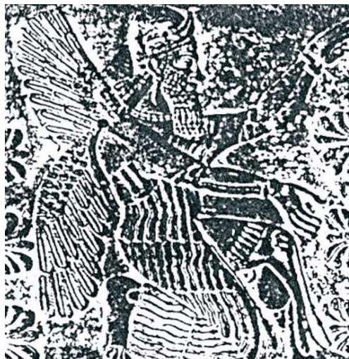
تصویر ۷ ایزدان بالدار در اطراف درخت زندگی (کاج).

موزه‌ی بریتانیا از نمونه آثار آشوری است [۹، ص ۱۴].