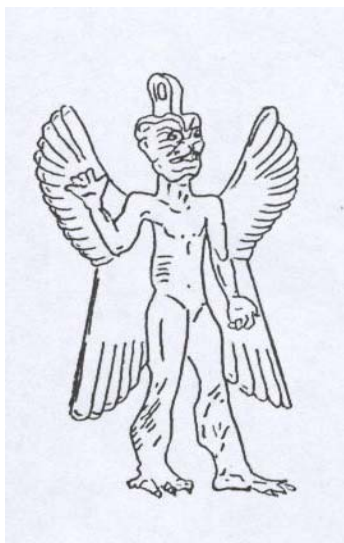
تصویر ۳ اهریمن پازوزو (Pazuzu): دیوبالدار آشوری با چهار بال، آورنده‌ی بیماری خطرناک و نشان‌دهنده‌ی بادهای توفنده‌ی جنوب شرقی، موزه‌ی لوور پاریس

یکی از تصاویر معروف کیش مهر مجسمه بازسازی شده‌ی خدایی به صورت مرد بالدار با سر شیر است که ظاهراً ماری دور او پیچیده شده که ملازم اوست. [۱۱، صص ۱۲۸ - ۱۳۰] (تصویر ۴) این مجسمه‌ها در بسیاری معابد مهری دیده می‌شود البته بعضی آن را نماد اهریمن یا زروان می‌دانند. بال‌های او طبیعت‌گرا و شبیه بال پرندگان است.