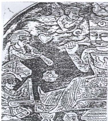
تصویر ۱۴ شاه در میان ملازمان و تصویر فرشته محافظ بالای سر، بخشی از سینی چکش کاری شده نقره‌ای ساسانی

فریر واشنگتن که در آن در بخش بالا سمت چپ کودک فرشته عریان با چوبی بلند در دست دیده می‌شوند و یکی احتمالاً جام شراب در دست دارد که نقش آنها با طرح پیچان تاک بالای سر پیکر اصلی در ارتباط است. کودک فرشته نیز در پایین تصویر تخت پیکره اصلی در طرفین یک چرخ دیده می‌شود. سر فرشتگان نسبت به بدن بی تناسب است، بال‌ها کوتاه است و از دو بخش اصلی تشکیل شده است. زن نشسته بر تخت و سایر پیکره‌ها نیمه برهنه‌اند (تصویر ۱۴). نمونه موجود دیگر در همین گالری تصویر شاه با نوازندگان و خدمتکاران است که فرشته‌ای در بالای سر او روبانی را در دست دارد. پیکره‌ها (همگی مرد) و فرشته‌ها در این تصویر؛ همگی ملبسند (تصویر ۱۵). چکش کاری روی ظروف و نقش برجسته‌های این دوره، ذره‌گرایی هخامنشی را احیا نموده است.